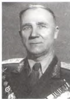
Ф. А. Кандыдатаў.

сустрэў у Прыбалтыцы ў званні капітана, а скончыў генерал-маёрам у Германіі, на Эльбе. За час вайны Ф.А.Кандыдатаў быў узнагароджаны ордэнамі Леніна, 4 Чырвонага Сцяга, 2 Чырвонай Зоркі, Суворова, Кутузава, Айчынай вайны і нават амерыканскім ордэнам. Памёр Ф.А.Кандыдатаў 2.2.1981 г. у Мінску.