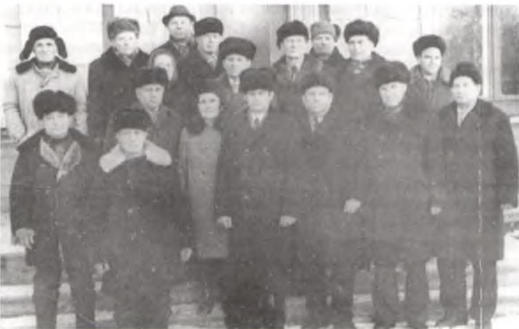
Здымак на памяць. У час адной з сустрэч партызан 42-га, 48-га атрадаў і падпольшчыкаў. Люты 1976 г.

Произведено 12 засад по Варшавскому шоссе на перегоне Чериков—Пропойск. 22 случая минирования полотна шоссе и дорожки. Спущены под откос 4 воинских эшелона с живой силой и техникой противника. Взорвано 900 метров рельс. В основном велись бои из засад на перегоне Чериков—Пропойск по Варшавскому шоссе. На засаду выделялся один взвод 40—45 человек с 6 пулемета-