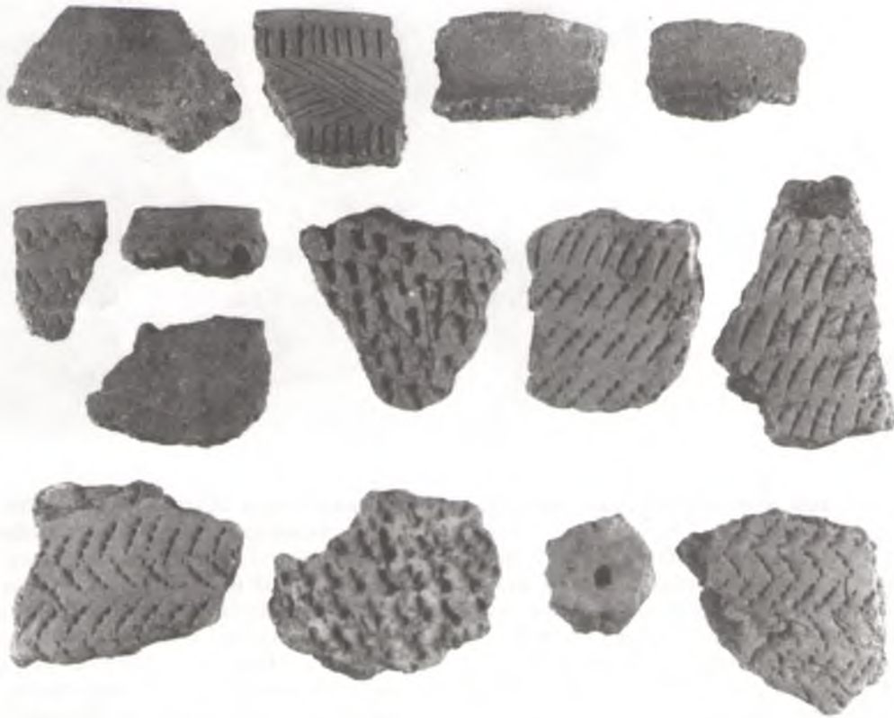
Фрагменты ляпных пасудзін эпохі неаліту і бронзавага веку, знойдзеныя каля в. Кліны.

керамікі), са з'яўленнем якіх на прасторах Еўропы адбыліся значныя перамены. Яны прынеслі з сабой навыкі земляробства і жывёлагадоўлі, выраблялі баявыя сякеры і ўпрыгожвалі свой посуд адбіткамі шнура.