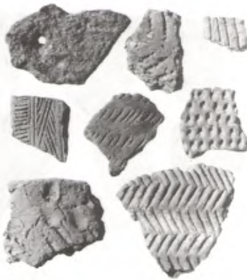
Фрагменты пасудзін бронзавага веку, знойдзеныя ва ўрочышчы Курган каля в. Рудня.

дзены і ва ўрочышчы Сасновая Грыва (Саснавец) каля в. Старая Каменка.