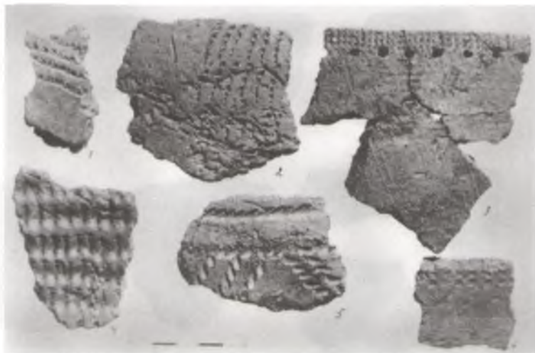
Фрагменты пасудзін эпохі неаліту, знойдзеныя ў час археалагічных раскопак каля в. Дубна.

вугольнай формы. Яго памеры 2x2,25 і 1,75x2,85 м.