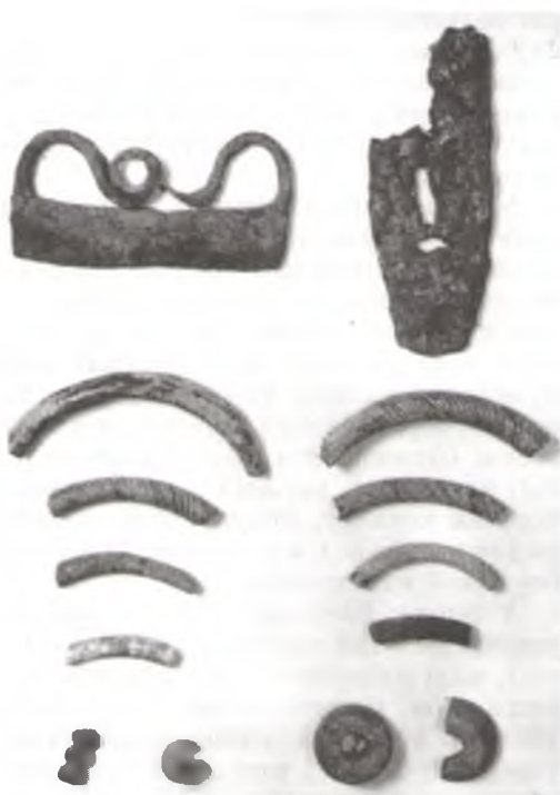
Археалагічныя знаходкі з гарадзішча Замкавая гара ў Слаўгарадзе: крэсівы, фрагменты шкляных бранзалетаў, шкляныя пацеркі, шыферныя прасліцы.

Шматразова засялялася найбольш вядомае слаўгарадчанам гарадзішча ў самім горадзе. Завецца яно Замкавая гара. Размешчана на высокім правым беразе Сожа, каля вусця р. Проня (зараз у гарадскім парку). Пляцоўка памерам 40x95 м выцягнута з поўдня на поўнач. Вышыня над узроўнем ракі каля 30 м. Шырынёй каля 20 м, глыбінёй 11 м. З заходняга боку ўмацавана ровам. У 1967 г. Г.В.Штыхаў, у 1974 г. М.А.Ткачоў, у 1988 г. А.А.Мяцельскі правялі на гарадзішчы раскопкі. Перамешаны культурны пласт месцамі дасягаў 1,8 м і ўтрымліваў матэрыялы эпохі неаліту, розных культур жалезнага веку і Кіеўскай Русі. Выяўлены драўляныя ўмацаванні ў выглядзе частакола X—XI ст. Не раней XII ст. быў зроблены земляны вал з драўлянымі сценамі —