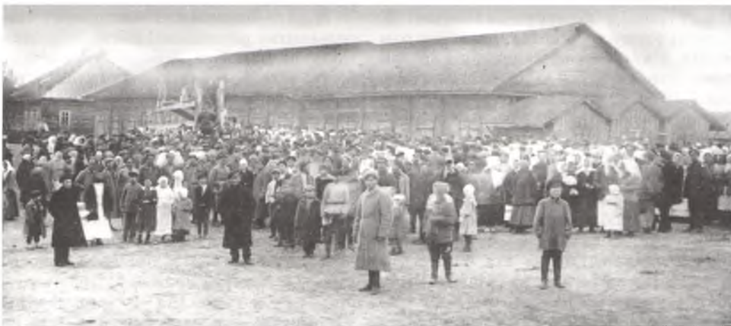
Мітынг у Прапойску. 1918 г.