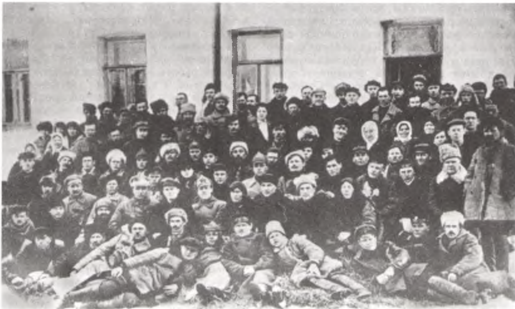
Дэлегаты 3-га раённага з'езда Саветаў.

Цікавы гэта быў час. З энтузіязмам працавалі людзі.