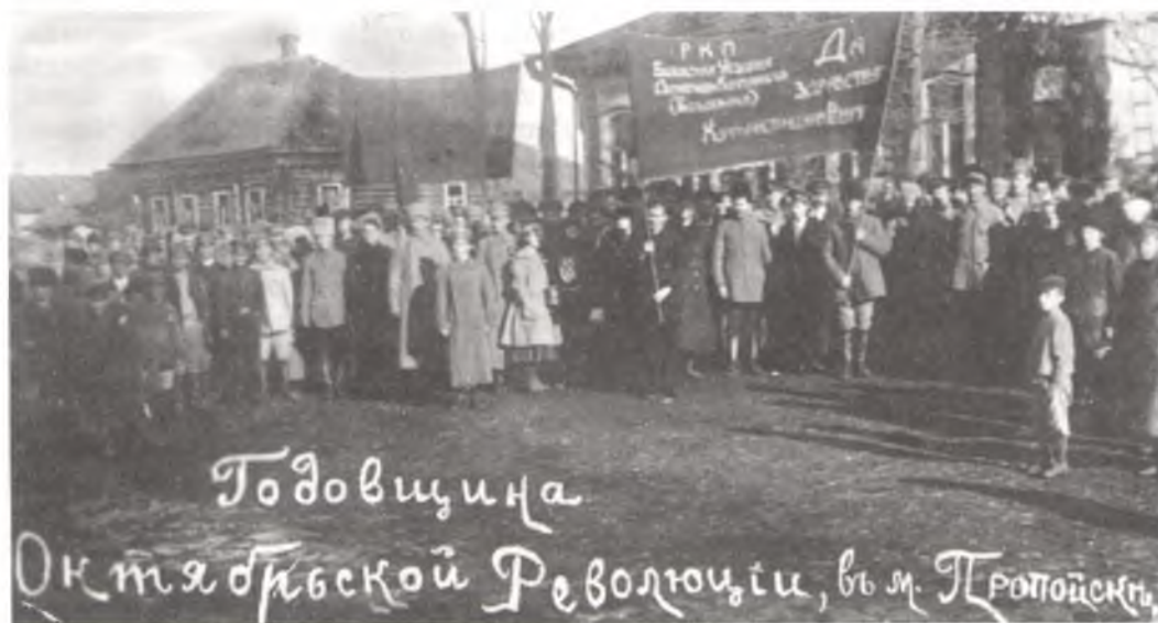
Святкаванне 1-й гадавіны Кастрычніцкай рэвалюцыі ў Прапойску. 8 лістапада 1918 г.

Паўсядзённы клопат павятовы рэўком праяўляў аб дзейнасці падпольных груп, што засталіся на правабярэжжы. А ў пачатку жніўня 1918 г. на партыйнай канферэнцыі падполь-