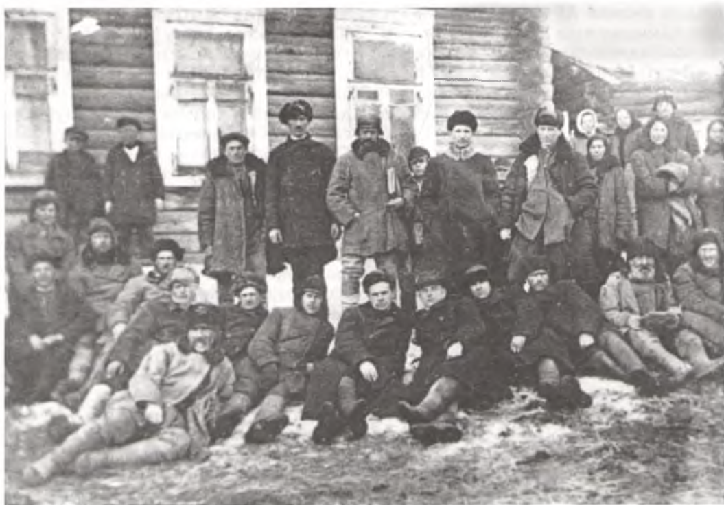
Калгаснікі каля праўлення сельгасарцелі «Ленінец». 1931 г.

С.М.Будзённага ў Свенску і іншых вёсках. Краіна, а разам з ёй і Слаўгарадчына падыходзіла да мяжы, з якой пачнецца ўпартая і доўгая барацьба за суцэльную калектывізацыю. І на шляху да яе будзе зроблена нямала памылак з абодвух бакоў. Аднак большасцю насельніцтва праводзімыя пераўтварэнні ўспрымаліся як адзіна правільныя і горача падтрымліваліся, асабліва беднай. Яна і ў калгасы ішла добраахвотна. Цяжэй было з сярэднякам і заможным селянінам — кулаком. Яны перш за ўсё траплялі ў няміласць мясцовых кіраўнікоў. У лютым 1931 г. шмат гаварылі аб падзеях у в. Дашкаўка. Імкнучыся хутчэй пакончыць з кулакамі і дасягнуць лепшых паказчыкаў у калектывізацыі сельскай гаспадаркі, мясцовыя кіраўнікі ўсю сваю працу зводзілі да лаянкі, пагромаў і прымянення фізічнай сілы. Іх дзеянні сталі вядо-